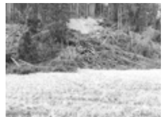
山が崩れて川を越え田んぼの3分の1を埋めた