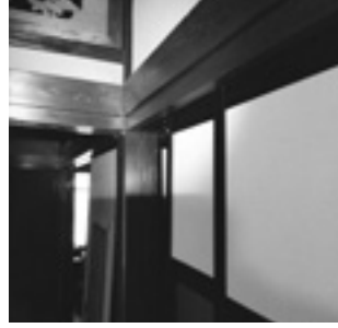
母屋の中の柱が中央で折れて傾く

を連結するために造った防御と水運を兼備えた堀で、人、物、情報を集め城下を大いに活気づけたらしい。昭和になり不要になった堀はドブ川のように荒れていたようですが、今ではきれいに整備され、豪商たちの白壁土蔵や旧家が立ち並び保存されていました。保存された近江商人発祥の街並み散策を楽しんだ後、JR近江八幡駅で宇羅さんたちを見送って家路につき、18：30無事にJR大阪駅で解散しました。