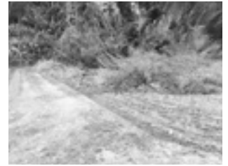
山が崩れて川を越え田んぼの3分の1を埋めた