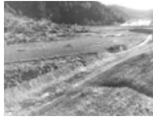
山が崩れて川を越え田んぼの3分の2を埋めた

宇羅さんからは後日お礼のハガキが支援者皆様に届きました。一步一步前進します。前向きに頑張っています。