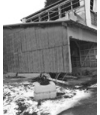
物置が壊れた(手前)。 土台・柱・壁。奥の方の作業所が壊れた。 屋根がずれる。壁が外れる。