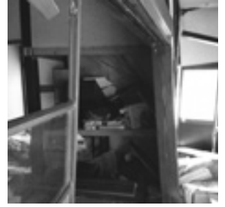
母屋：柱の下が押し出され柱が傾く 押し入れの鴨居が落ちている